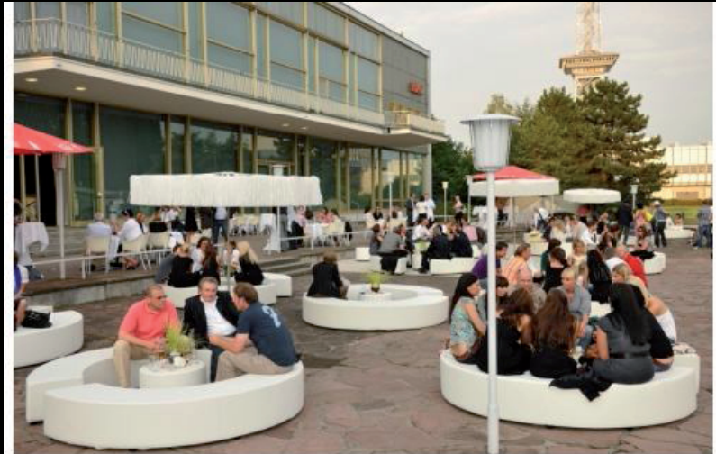
Gelöste Stimmung bei der Opening-Party vor dem Funkturmparlais.