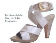
Der Name ist die Idee, nicht das Programm.

Kontakt Europa: Mike Intel & Friends, Steinbergweg 45, 64285 Darmstadt, Deutschland, T 0049.6151.997649 oder 0049.171.6917710, shoes@hollywood-the-shoes.com www.hollywood-the-shoes.com