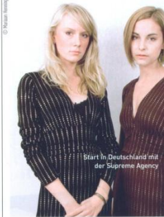
Start in Deutschland mit der Supreme Agency